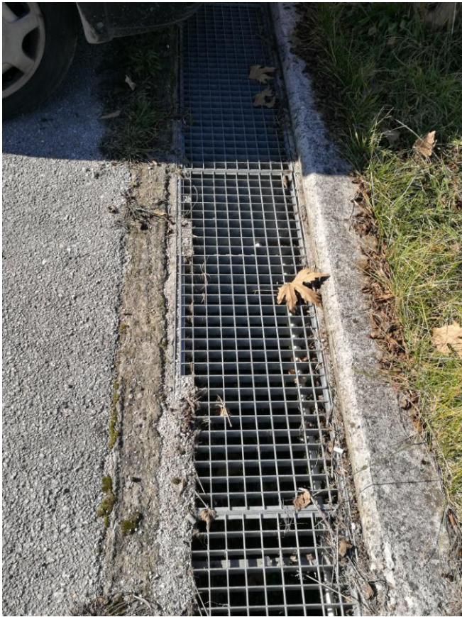
Σχάρες υδροσυλλογής ομβρίων